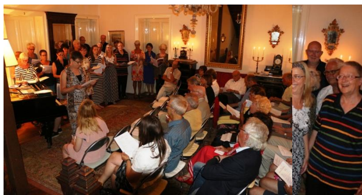
Indrukken van afgelopen zingweken.

http://www.youtube.com/watch?v=uKsmKPL-uLc